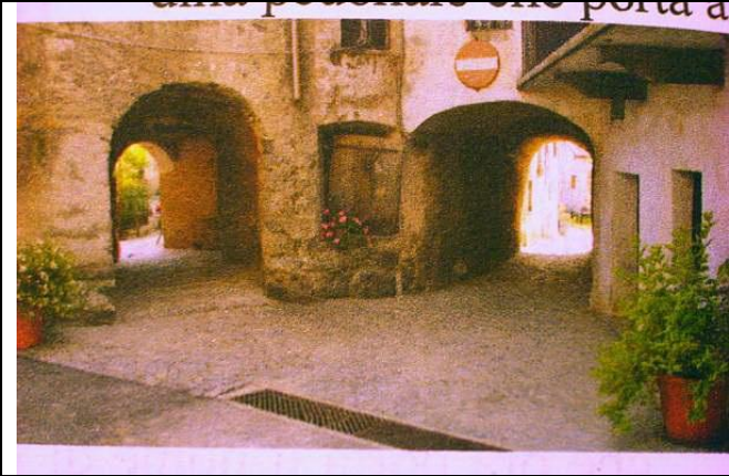
6 agosto 2009 Fuori porta a Vico Canavese