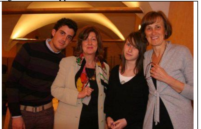
I giovani del Rypen e le loro mamme