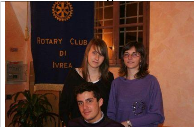
25 marzo 2010 Serata su Rypen e C. America