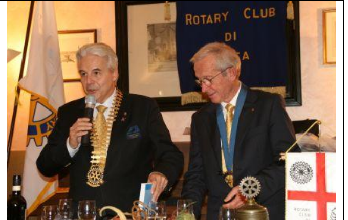
Il saluto del Governatore