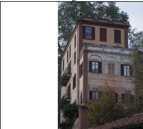
Il Castello di Azeglio