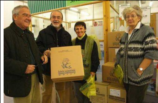
28 novembre 2009 Service al Banco Alimentare