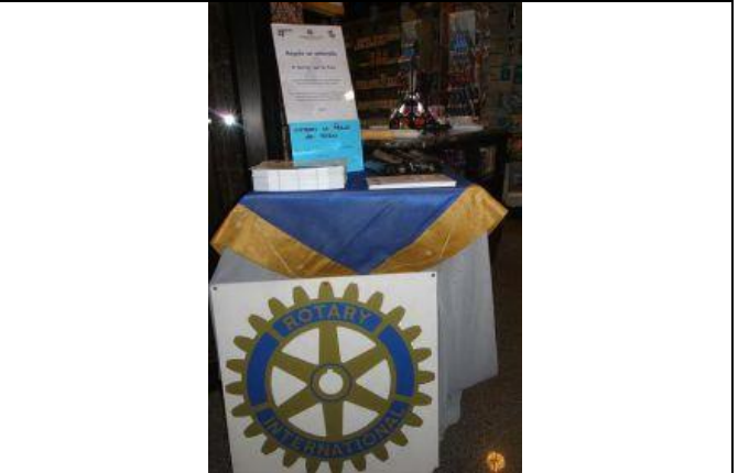
5 dicembre 2009 Richiesta per Polio Plus