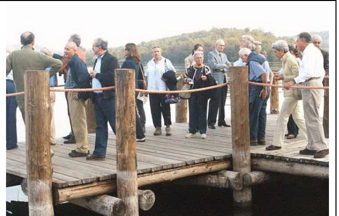
26 settembre 2009 Pomeriggio al lago di Azeglio